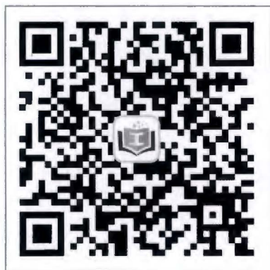
广东职工教育网公众号

第一步 关注广东职工教育网公众号（gdzgjy）选择微教育栏目“学历提升”进行求学圆梦公共服务平台