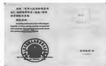
国家职业资格三级（高级）