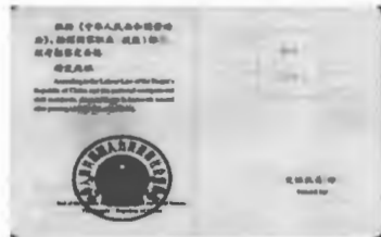
国家职业资格一级（高级技师）