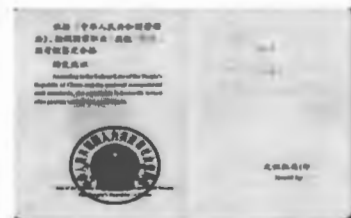
国家职业资格四级（中级）