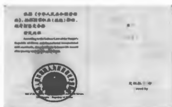
国家职业资格二级（技师）